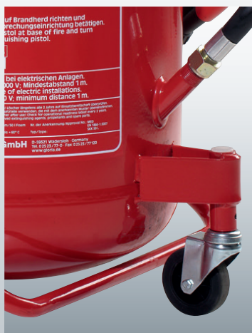
Lenkrolle und Standbügel